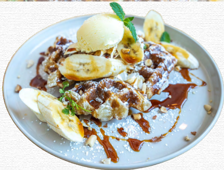
バナナとローストナッツのクロワッフルパンケーキ ¥2,200 Cro-waffle pancakes with banana and roasted nuts

甘さ控えめのキャラメルソースに、バナナと香ばしいナッツをトッピング キャラメルソースはチョコソースにも変更OK キャラメルとチョコのダブルソースは追加 ¥100 ※ハーフサイズ ¥1,200