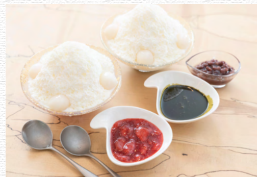
いちごミルクかき氷 ¥1,200 Strawberry milk shaved ice 抹茶黒蜜かき氷 ¥1,200 Matcha shaved ice with brown sugar syrup

アフォガードはイタリアの発祥のデザートで 「溺れたアイスクリーム」 熱々のエスプレッソをかけた、ちょっぴり 大人なデザート