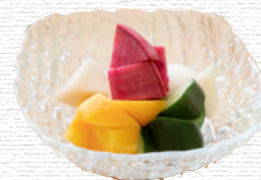
三浦野菜の自家製ピクルス ¥600 Miura vegetables homemade pickles

国産生米麺を使用した、食べ応えツルツルのフォー 優しいスープに、三浦野菜や蒸し鶏をトッピング クセがなく、食べやすい一杯 おすすめはパクチートッピング (¥200)