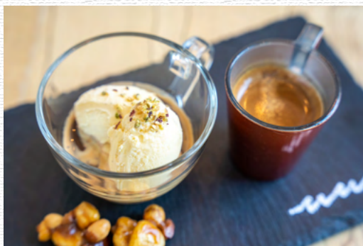
アフォガード ¥1,000 Afo guard

クロワッサンをワッフルに仕立てた、バター香る一品 サクッとモチッと新食感フレッシュいちごとホイップをトッピングしたデザートプレート チョコソースの追加 ¥100 ※ハーフサイズ ¥1,300