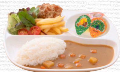
お子様カレープレート ¥800 Kid's curry plate

甘口のカレーと唐揚げ、ポテトをスタンバイ 3色ゼリーを添えた、お子様専用プレート