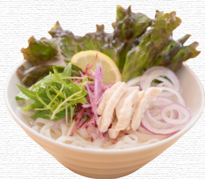
産直野菜のチキンフォー ¥1,300 Pho with vegetables and chicken

国産生米麺を使用した、食べ応えツルツルのフォー 優しいスープに、三浦野菜や蒸し鶏をトッピング クセがなく、食べやすい一杯 おすすめはパクチートッピング (¥200)