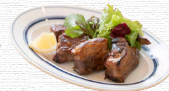
骨付きスペアリの照り焼き (単品) ¥1,900 Teriyaki spare ribs