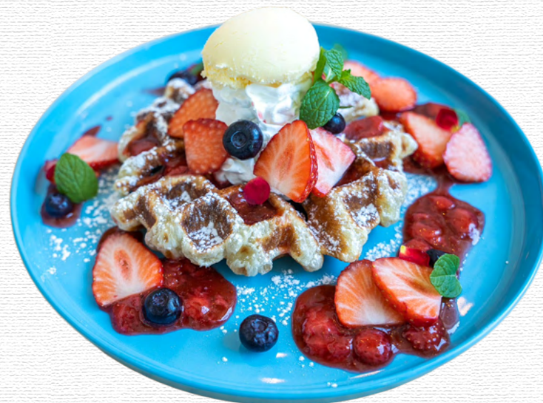
いちごのクロワッフルパンケーキ ¥2,300 Cro-waffle pancakes with strawberry

甘さ控えめのキャラメルソースに、バナナと香ばしいナッツをトッピング キャラメルソースはチョコソースにも変更OK キャラメルとチョコのダブルソースは追加 ¥100 ※ハーフサイズ ¥1,200